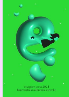
etxepare saria 2021 haurrentzako albumak sortzeko