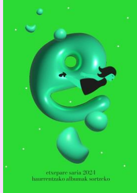
etxepare saria 2021 haurrentzako albumak sortzeko