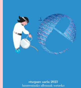
etxepare saria 2023 haurrentzako albunak sortzeko