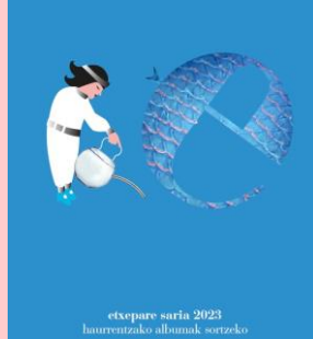
etxepare saria 2023 haurrentzako albunak sortzeko