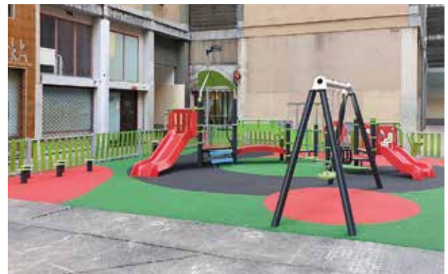
Haur-parke berria. Nuevo parque infantil.

Para mejorar la calidad de vida de la ciudadanía, en los últimos meses, el área de Urbanismo del Ayuntamiento de Barañáin ha acometido diversas actuaciones en espacios como centros educativos, parques y jardines o diversas vías. Además, próximamente se acometerán acciones de mayor envergadura.