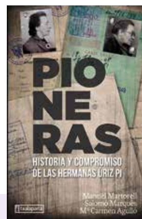
Úriz Pi ahizpei buruzko biografia-liburua. Libro-biografía sobre las hermanas Úriz Pi.