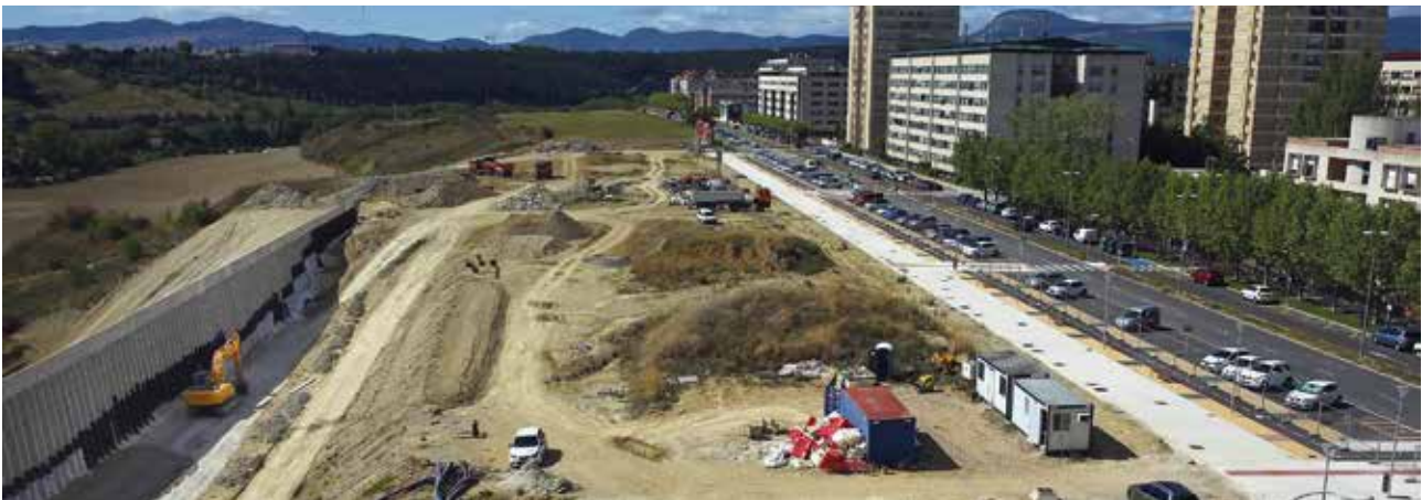
Iruñeko etorbideko etxebizitza berrien lanak aurrera doaz. Prosiguen las obras de las nuevas viviendas en la Avenida Pamplona.