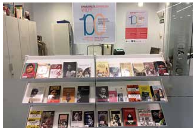
Bake eta askatasunaren aldeko emakumeei buruzko liburu-erakustaldia. Muestra de libros sobre mujeres por la paz y la libertad.

En el marco de la exposición, la biblioteca ha presentado una Muestra de Libros sobre Mujeres por la Paz y la Libertad con el fin de que la ciudadanía de Barañáin pueda profundizar más en la figura de todas ellas. Así, las personas interesadas pueden conocer más acerca de mujeres valientes como la Madre Teresa de Calcuta, Rigoberta Menchú, Malala o Clara Campoamor, entre otras. Además, la muestra incluye títulos que presentan realidades de muchas mujeres que viven o han vivido bajo leyes injustas. Títulos como Persépolis , No sin mi hija , La mujer olvidada o Sufragistas ayudan a conocerlas.