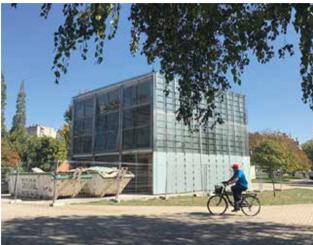
Lakuko kuboa kentzeko lanak. El Cubo del Lago, durante su desmantelamiento.

Udalaren osoko bilkurak, abuztuaren amaieran, 2019ko aurrekontuan inbertsio hori aurrera ateratzeko kontu-sail bat onetsi zuen aho batez. Izan ere, iazko maiatzean onetsi zen inbertsioa, baina ez zen 2019rako aurreikusitako gastuen barruan jaso.