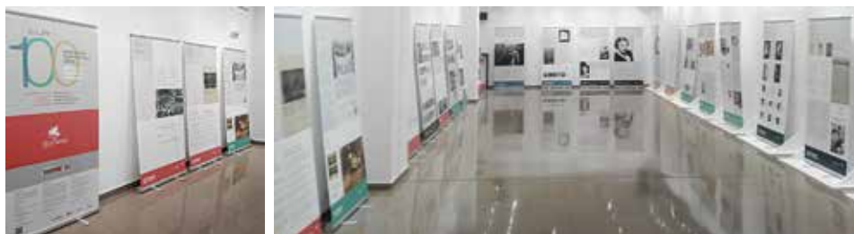
Bake eta askatasunaren aldeko emakumeen nazioarteko Elkartearen erakusketa. Exposición de la liga Internacional de Mujeres por la Paz y la Igualdad.

Octubre ha sido el mes de las mujeres en la Biblioteca M a Luisa Elío y en la Casa de Cultura, que han acogido diversas iniciativas en torno a la figura de muchas de ellas que han sido estandarte en su lucha por la igualdad.