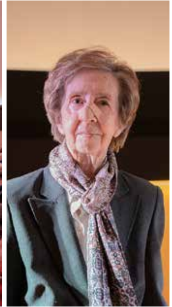
Margarita Salas en el Planetario de Pamplona en 2018 en su visita a Navarra. Margarita Salas Iruñeko Planetarioan Nafarroara egindako azken bisitan.