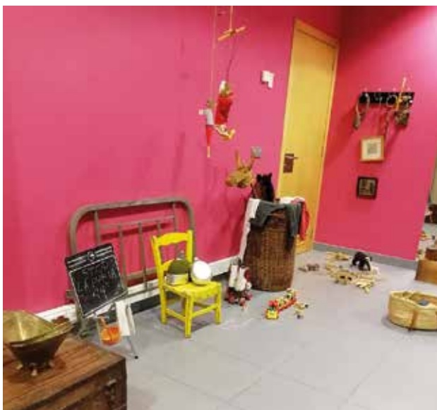
Diferentes salsa recreaban aspectos de la vida en los años 50 y 60. Egongela desberdinek bizitzaren alderdiak birsortzen zituzten 50-60 urtetean.