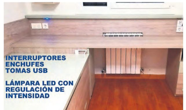
Innovaciones de Armario BASS.

más, se ofrece la posibilidad de pago aplazado de los muebles a través de Caja Rural de Navarra, mediante la