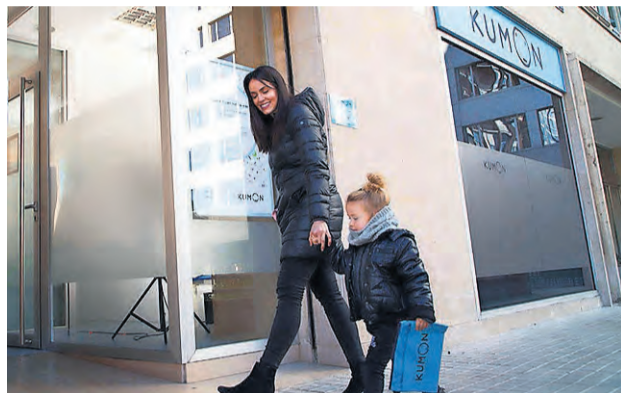
Instalaciones de Kumon.

En Kumon, la aventura de aprender y desarrollar la inteligencia empieza desde pequeños. Las entretenidas hojas de ejercicios les acercan a los números y les introducen en el