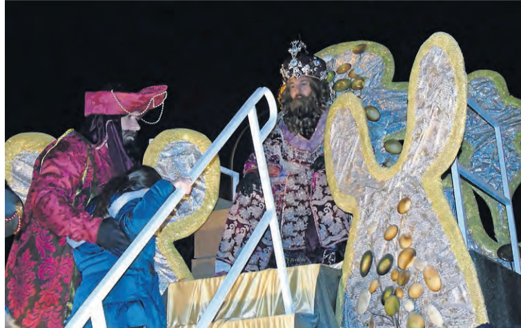
Una niña se acerca para saludar al rey Baltasar en la cabalgata de Barañáin.

También lleno de color y visosidad será el atardecer del día 5 de enero. Ya arrancado el 2020 y con la ilusión que caracteriza esta fecha, esperaremos a Sus Majestades, los Reyes Magos de Oriente, desde las 18:30 en la parroquia de San Pablo, desde donde comenzará un desfile muy especial. La salida de la iglesia, uno de los momentos más emotivos de la cabalgata beriniana, es ocasión para darles un apretón de manos y verles cara a cara. Saldrán andanddo saludando con cariño a todo el público hasta el colegio Santa Luisa de Marillac, donde tendrá lugar el momento de la adoración al niño Jesús. A la salida, en la calle Pedro Bidagor, montarán en sus espectaculares carrozas rodeados de pajes, antorchas, grupos de música y animación.