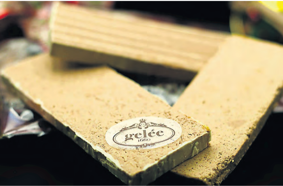
Turrón artesano. En Gelée ya preparan hasta 15 variedades diferentes.

Turrón Gelée hojaldre, limón y canela, mazapanes de mantequilla con vainilla, mazapán trufado y los trufados de mar de cava y baileys, postres ideales para sorprender haciendo un guiño a la tradición