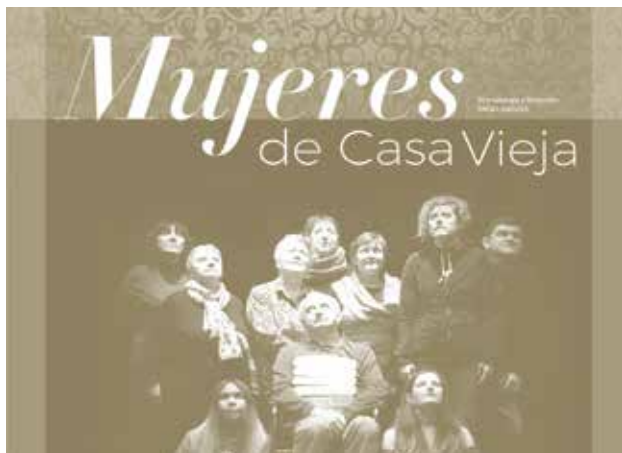
Cartel de la obra del taller de teatro de Irurtzun. Irurtzuno antzerki tailerren antzezlanaren kartela.

Irurtzuno, Orkoieno, Barasoaino eta Barañaino antzerki tailerretako kideek azken hilabeteetan landu dituzten antzezlanak jendaurrean aurkeztuko dituzte.