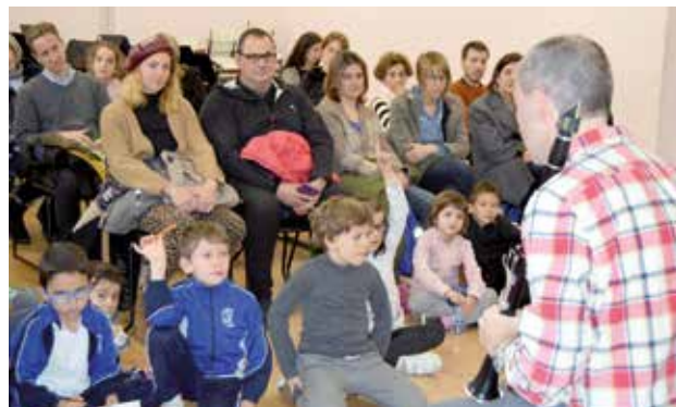
Dos momentos de la sesión de enseñanza de instrumentos a los más pequeños. Argazkietan, musika-tresnak nola jo irakasten txikienei.