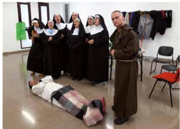
Orden de clausura. Obra del taller de teatro de Barañain. Orden de clausura. Barañaino antzerki tailerren antzezlan.

Las personas participantes en los talleres de teatro de Irurtzun, Orkoien, Barasoain y Barañain presentan en público las obras trabajadas en los últimos meses.