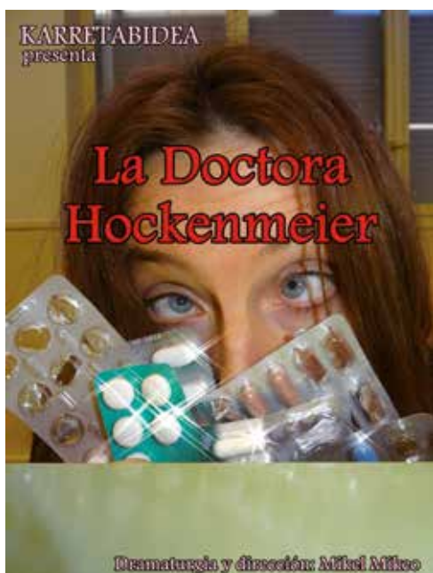
Cartel de la obra del taller de teatro de Barasoain. Barasoingo antzerki tailerraren antzezlaren kartela.

Lan guztiak 20:00etan antzetzuko dira, eta ikusi nahi dituen edonor gerturatu daiteke.