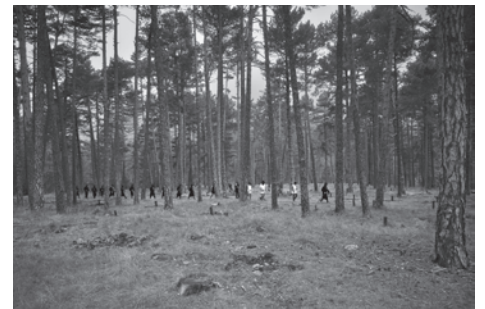
Autor: José Manuel Sos.