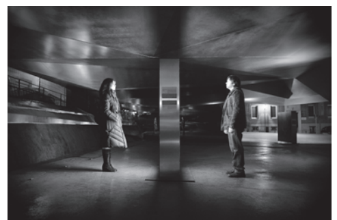
Autor: José Luis Morales.