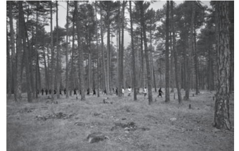
Egilea: José Manuel Sos.