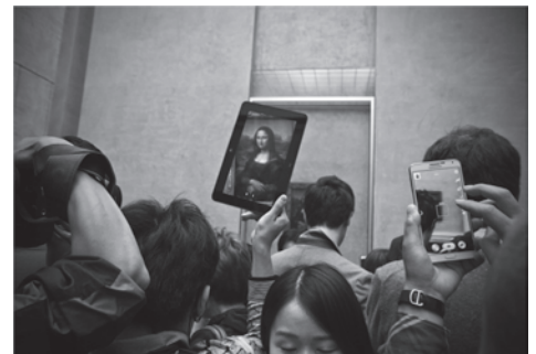
Autor: Manuel Navarro.