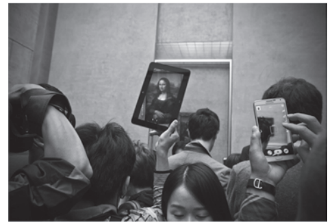
Egilea: Manuel Navarro.