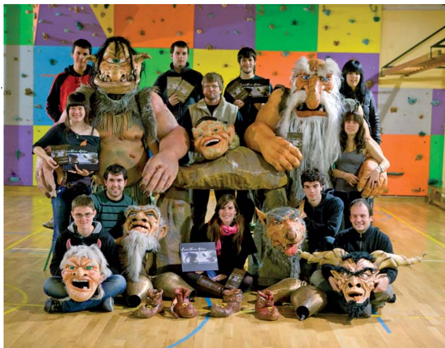
Grupo de animación Orritz-Iskidi.

multimedia dedicada a los personajes y seres mitológicos vascos. Consta de un libro y un DVD titulados "Euskal Herriko mitologia. Jentilen aztarnen atzetik".