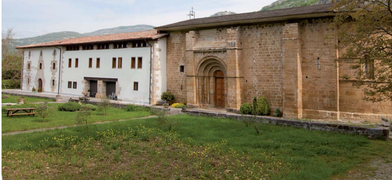
Monasterio de Zamartze, en Uharte Arakil.

En esta ocasión nos acercaremos a la parte más oriental de Sakana, conocida también en castellano como La Barranca, para visitar los municipios de Uharte Arakil, Irañeta, Arakil e Irurtzun.