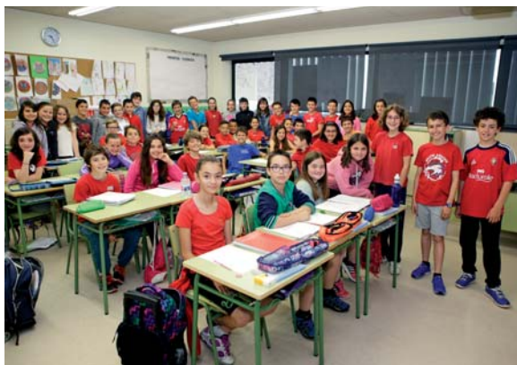
Alumnado del Colegio Público Virgen Blanca de Huarte, en el que se ha puesto en marcha el proyecto "Ikasle euskaldun eleaniztunak".

Hizkuntza desberdinetako irakasleek , beren artean edukiak, metodologiak, hizkuntza-jarduerak etab. adostu eta koordinatu behar dituzte eta gainerako jakintza arloetako irakasleek hizkuntzak eskuratzeko egin behar dituzten ekarpenen kontziente izan behar dute. Ezin dugu ahaztu pertsonok hobeto ikasten dugula hizkuntza bat beste zerbitu ikasten dugun bitartean.