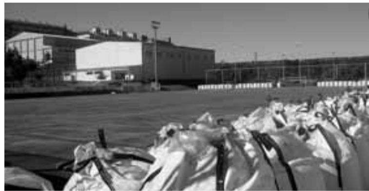
El campo de fútbol, con el césped retirado.

Al cierre de esta edición, no se habían iniciado las obras de las pistas, aunque se esperaba que lo hicieran en breve