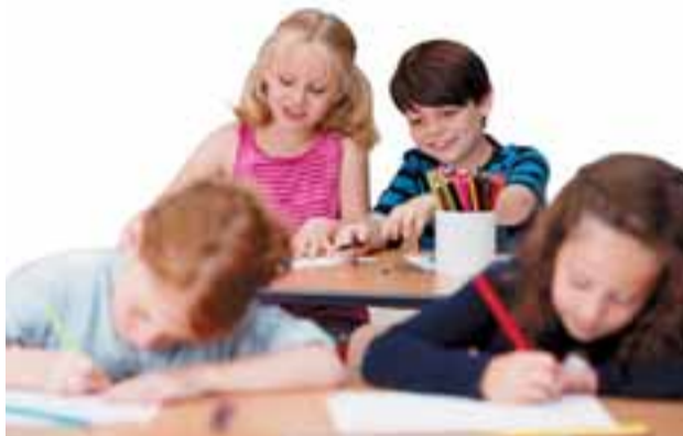
El plazo de inscripción en Linden para el nuevo curso permanece abierto.

Linden busca que sus alumnos conozcan el idioma