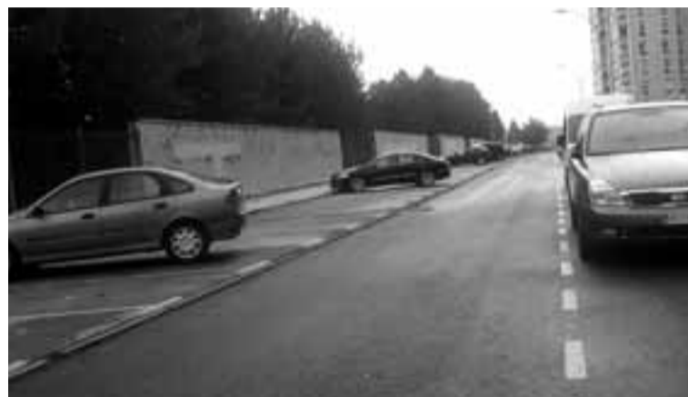
Zona verde en el Paseo del Estadio.

Ante esta situación y con numerosos vecinos haciendo cola ante la Oficina de Atención Ciudadana en la recta final de agosto y principios de septiembre para solicitar la tarjeta de aparcamiento que les permita el estacionamiento libre sin horario (aunque el plazo de solicitud se abrió el 1 de julio), la Policía Municipal, encargada de velar por el