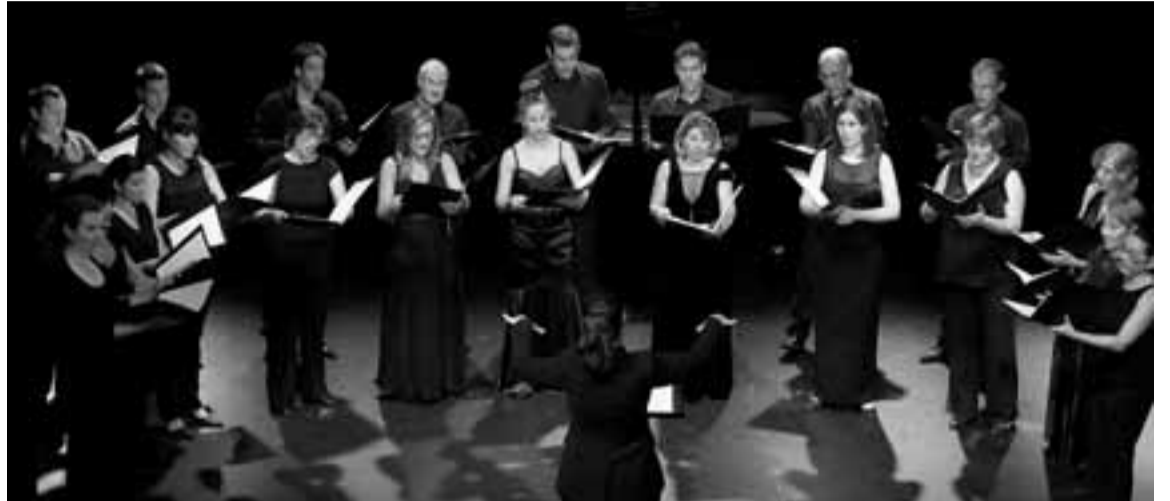
La Coral de Cámara de Pamplona será la protagonista del concierto benéfico.

Además, quien desee colaborar pero no pueda asistir al concierto el próximo 20 de septiembre, tiene la opción de ingresar