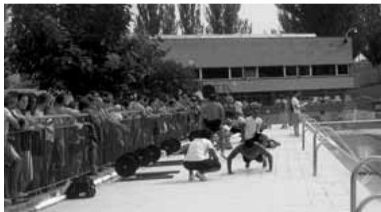
La competición 'The North Challenge' se desarrolló en distintos escenarios de Lagunak, entre ellos, en la piscina y su perímetro exterior.