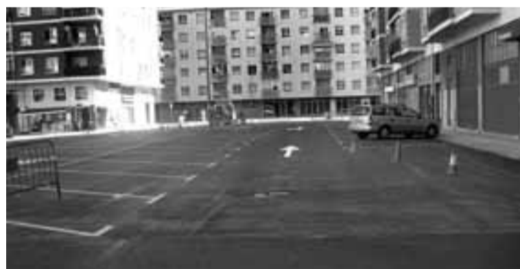
Obras de asfaltado y pintado de la zona verde en la plaza Los Sauces.