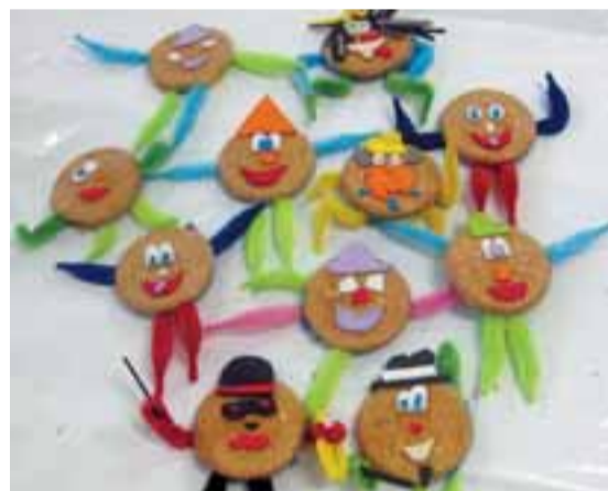
Galletas personalizadas y convertidas en imanes para el frigorífico por cada participante.