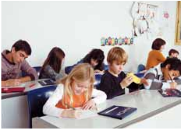
Gracias al Método Kumon, los alumnos experimentan grandes avances.

En el Centro de Barañáin se trabaja desde hace 20 años con los programas de Kumon sabiendo que es una actividad excelente en