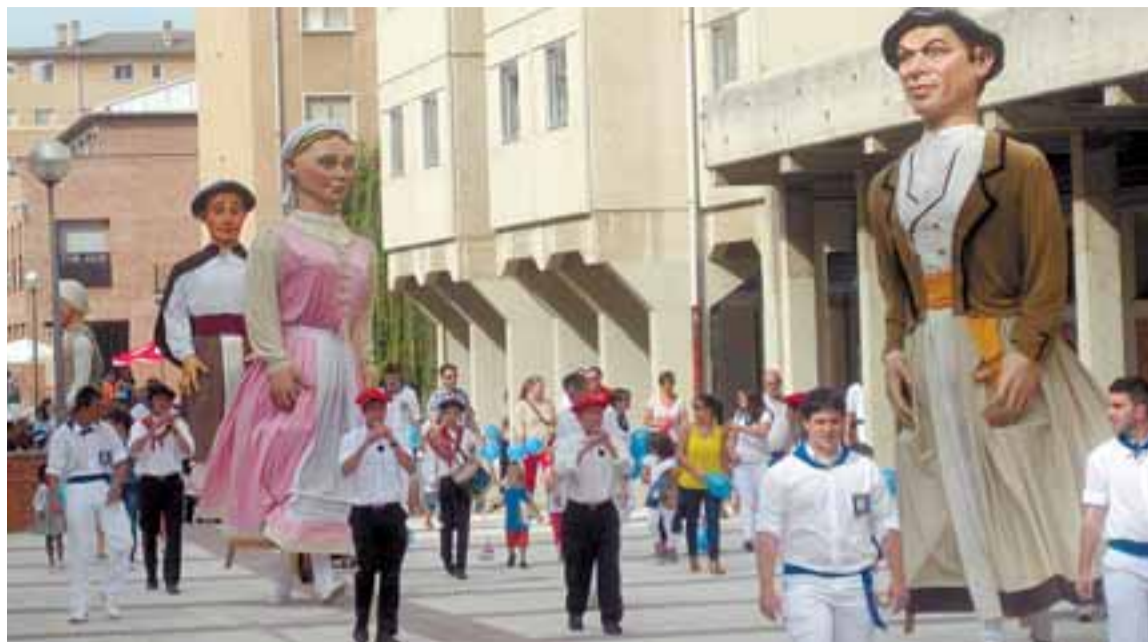
Gigantes y gaiteros a su paso por la avenida Comercial tras partir del ayuntamiento./T.B.