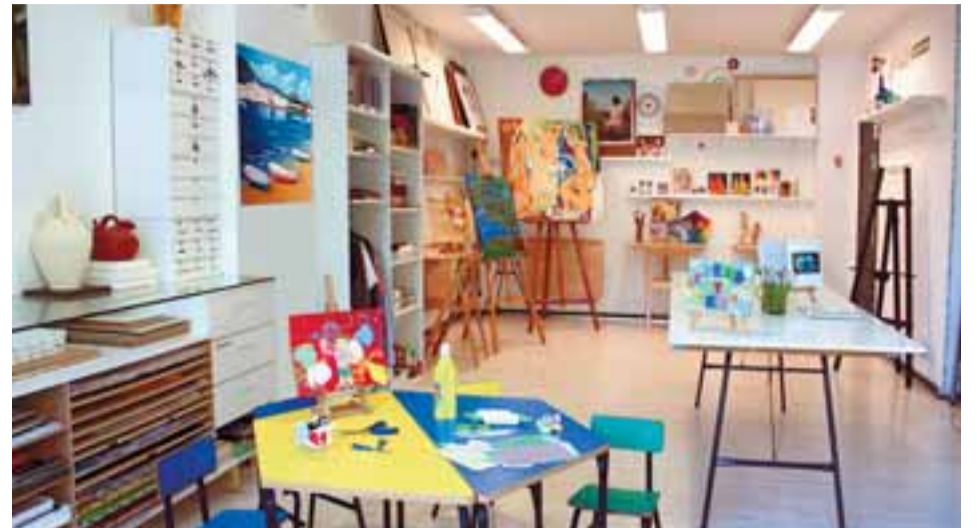
Masmarco ofrece un espacio perfecto para desarrollar los talleres.

MASMARCO AULA-TALLER Y ESPACIO DE ARTE Y DECORACIÓN