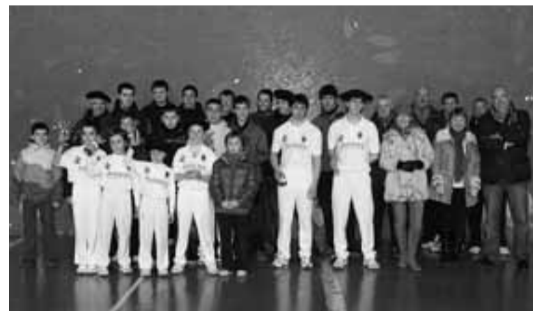
La escuela de pelota cuenta con una larga tradición en Barañáin, donde cada año se organiza el torneo de Navidad.