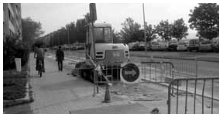
Habilitación de un nuevo tramo de carril bici en la avenida Pamplona./T.B.