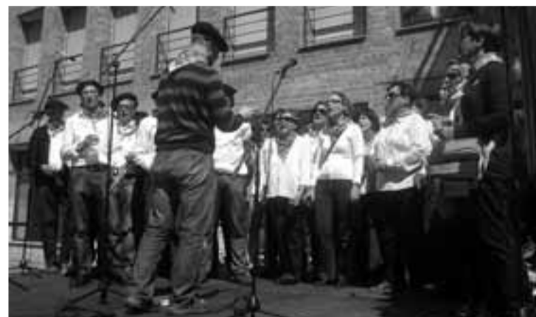
Taldea, Barañaingo Eguna ospatu zenean.

Barañaingo Euskal Kantak taldeak lortu du denboran irauten, ongi antolatutako talde indartsua delako. Gero eta toki gehiagotan daude, ez bakarrik herrian. Zizur, Alesbes, Tafalla, Aibar... herrietan ere izan dira kantuan. Taldeko abeslariak gozatu egiten dute eta entzutea hurbiltzen direnak ere disfrutatzeko aukera izaten dute.