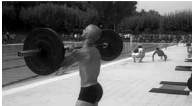
Un participante en la competición del pasado 6 de septiembre en Lagunak.