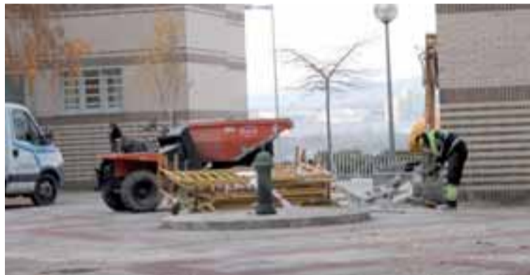
Primeros trabajos para la mejora de la pavimentación de la plaza Río Arga. T.B.

legislatura cuando se aprobaron las obras con el apoyo de los votos de los ediles del PSN y del PP, se señala que el actual equipo de gobierno "debería dar explicaciones sobre por qué no se han iniciado o no se van a ejecutar el resto de obras pendientes".