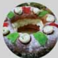
¿Fortuna? Roscos Gelée