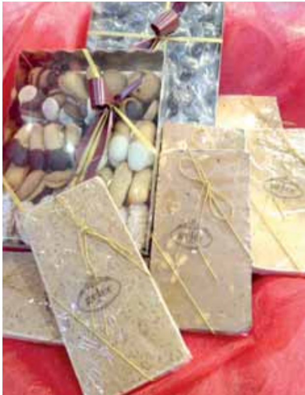
En estas fechas, Gelée suma los turrónes a la variada oferta de dulces que elabora cada día en su obrador.

La Navidad es tiempo de regalos y apostar por los