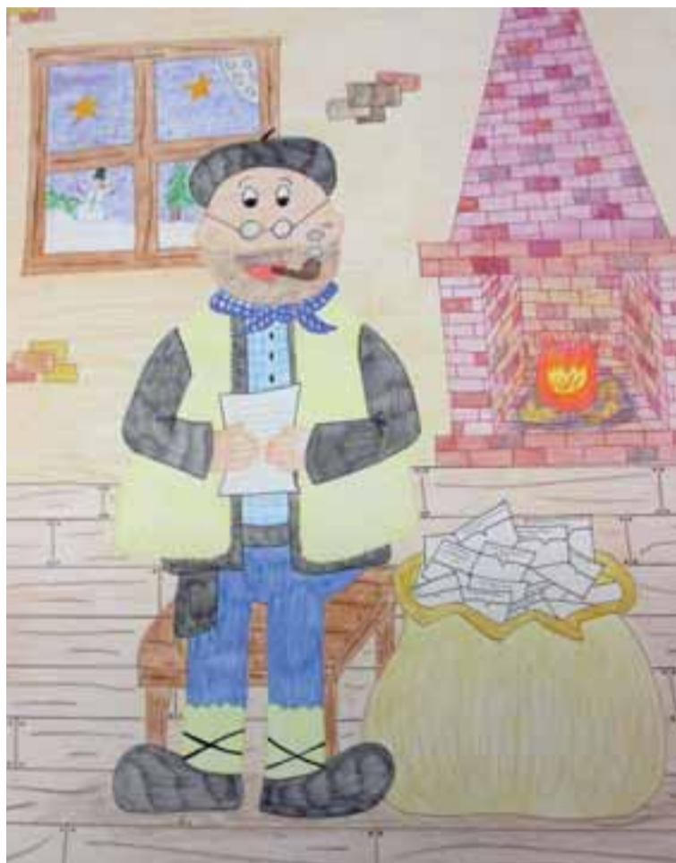
Cartel anunciador de Olentzero, obra de Lander Lareki Aramendia.

Los tres recibirán sus merecidos obsequios el día 24 en el Auditorio, tras la actuación de Popi y Zaratrako (12:30 h). También actuará Euskal Kantak y alumnos del Alaitz y del Bachillearto de Artes Escénicas del IES Alaitz. La mañana comenzará con un pasacalle con los dantzaris txikis de Harizti y concluirá con la esperada kalejira acompañando a