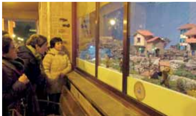
El belén se podrá contemplar hasta el 9 de enero./T.B.