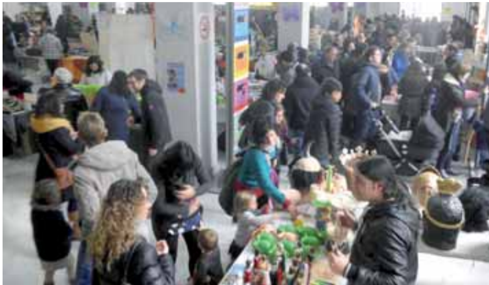
Aspecto del market celebrado el 12 y 13 de diciembre.