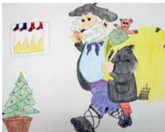
Trabajo de Lidia Yurchenko.