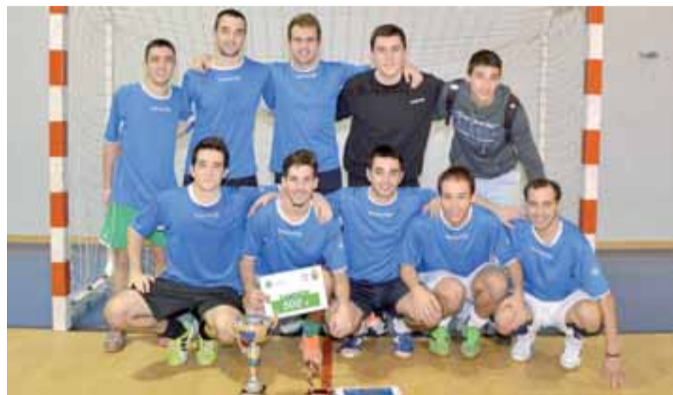
Pikillos, equipo ganador de la última edición del torneo.