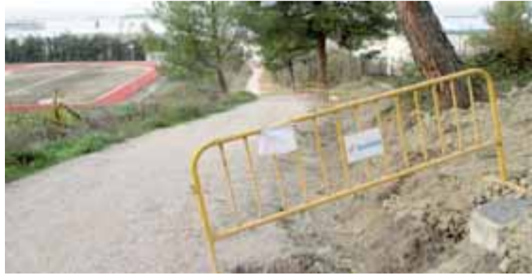
Inicio de los trabajos para la instalación de alumbrado en el acceso a las pistas. T.B.

En este sentido, desde UPN, grupo que gobernó la pasada