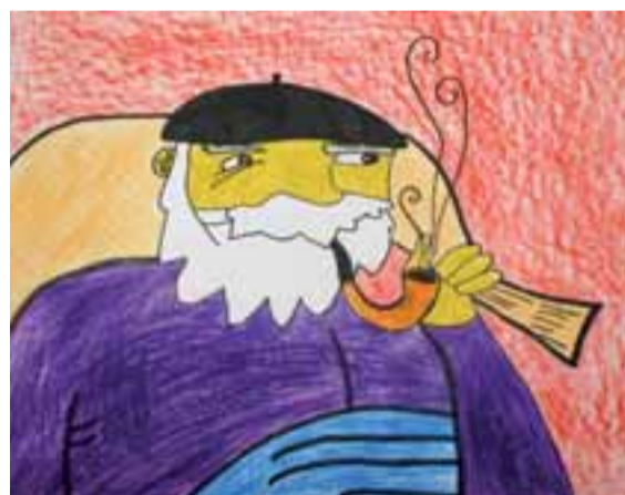
Dibujo de Aitana Beraza.

no sexistas) y material escolar. También se recogerá, aunque estén usados y siempre que presenten buenas condiciones, ropa, libros y otros materiales que la ciudadanía desee aportar. Será en la plaza Consistorial y habrá una castañada (16:30 a 20 h).