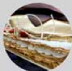
¿Dulzura? Gelée de nata

Tus mejores deseos deseos nuestra mejor pastelería