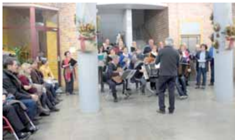
La Asociación Canto del Pueblo Viejo participó en el acto de inauguración del belén.