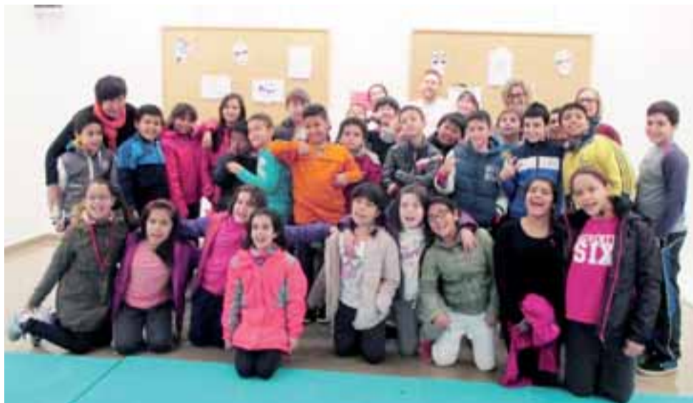
■ Alumnado del colegio Los Sauces-Sahats que participó en la actividad.