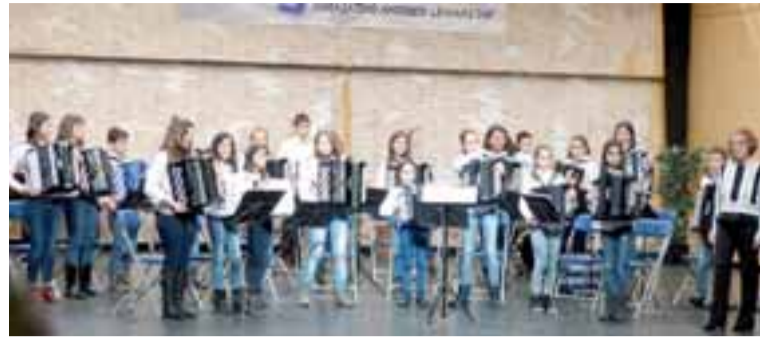
La Orquesta Txiki, junto con alumnos de la Escuela de Burlada, en su actuación en el Festival.