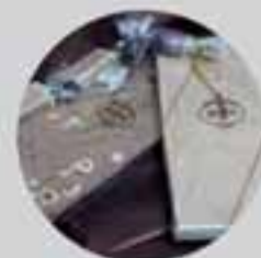
¿Armonía? Turrone Gelée