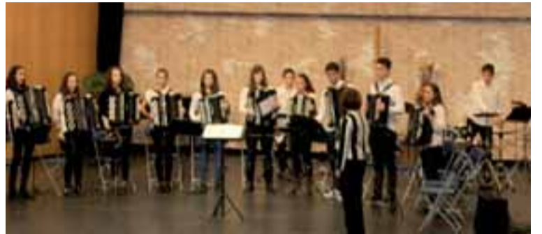
La Orquesta Joven rozó la medalla de oro.