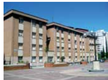
Aspecto actual de las casas.

riasgrupo.com ), con sede en San Sebastián. Pero antes, quiere constatar si existe demanda por parte de los vecinos. Por ello, solicita que, quienes tengan interés, se pongan en contacto con el Grupo Inmobiliario Chapitela (C/ Padre Calatayud 1-1ªA), que se encarga de la comercialización en Pamplona. Contacto: 633 410 237. Correo: javierlopezpatus@gmail.com . El Ayuntamiento valoró en su momento el solar en 660.068 euros. En la parcela, los compradores podrán ofertar viviendas de protección oficial.