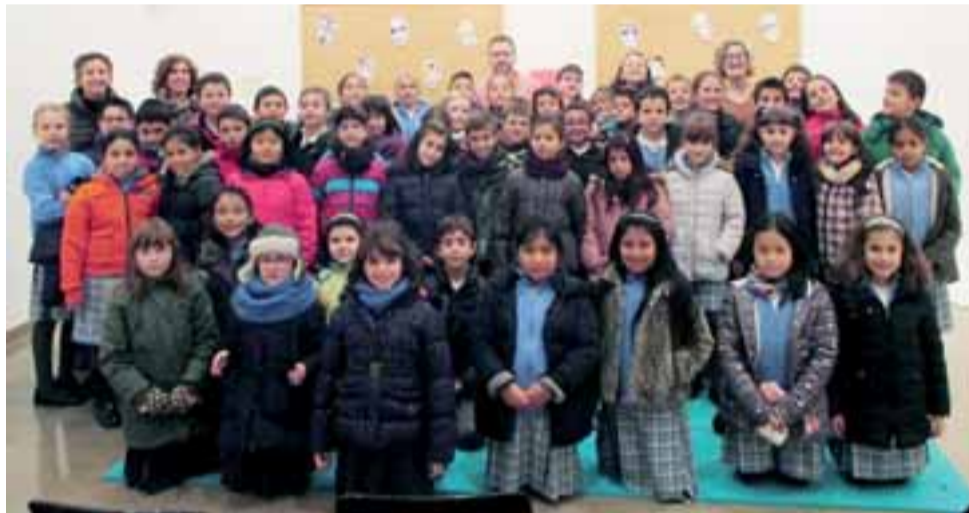
■ Estudiantes de Santa Luisa de Marillac.