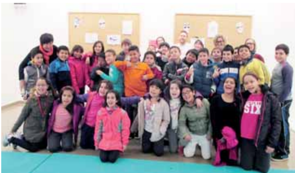
■ Alumnado del colegio Los Sauces-Sahats que participó en la actividad.