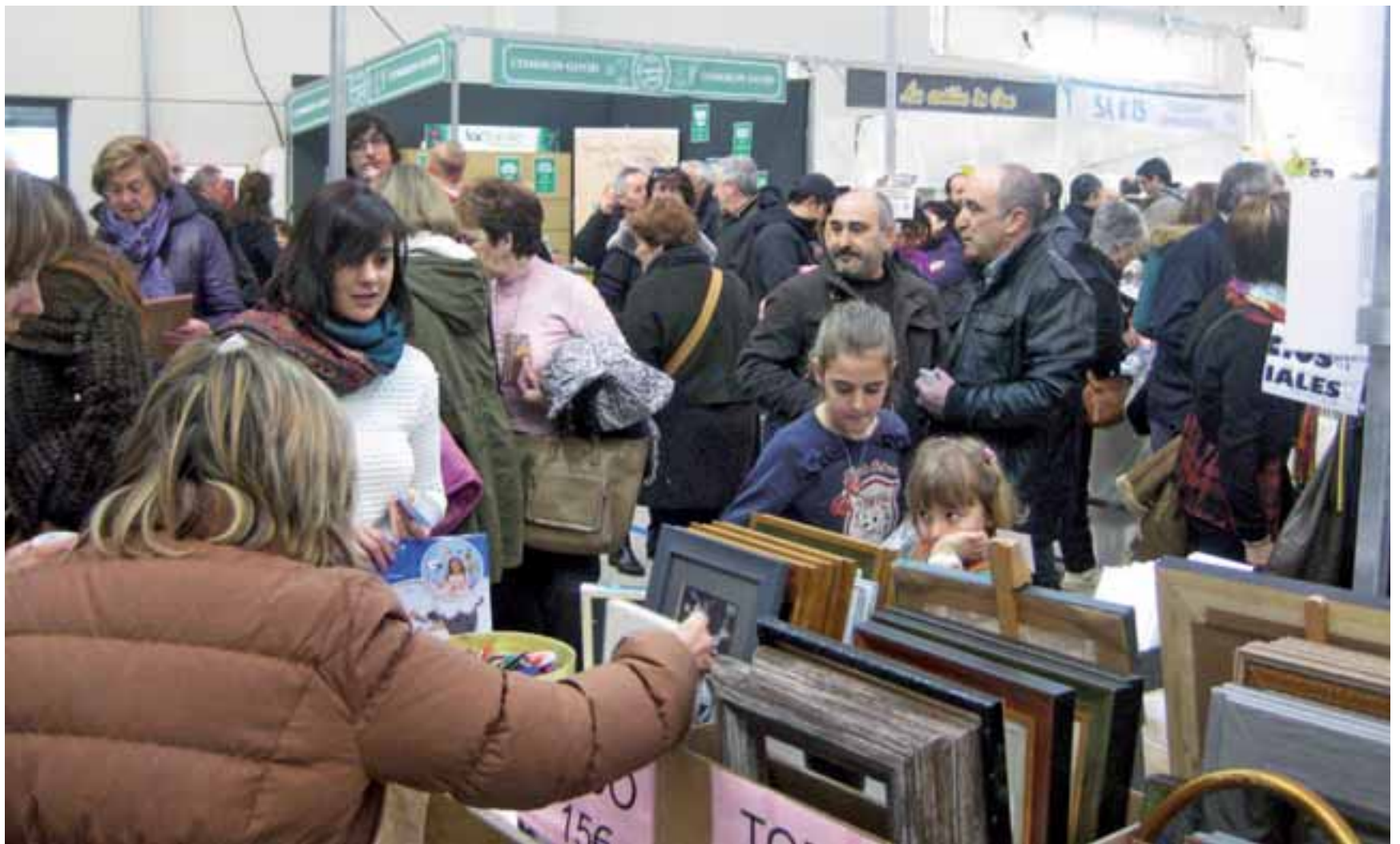
■ La feria contó con más de cuarenta stands de diferentes sectores que pusieron al alcance del público una amplia oferta de productos.