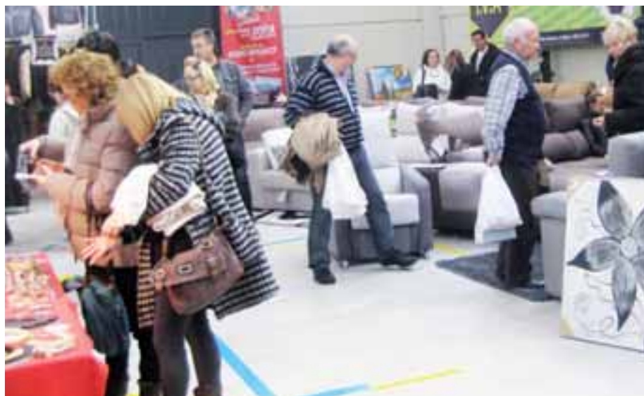
■ Imágenes de algunos de los expositores que pudieron recorrer quienes se acercaron al Polideportivo de Lagunak durante los tres días que duró la feria.

BISUTERÍA, COMPLEMENTOS, quesos y embutidos extremeños, empanadas gallegas, tartas, vinos, especias de todo tipo, artículos de caza y pesca, colchones, sofás... la lista de productos que se pudieron adquirir en la 3ª Feria de Barañáin fue extensa.