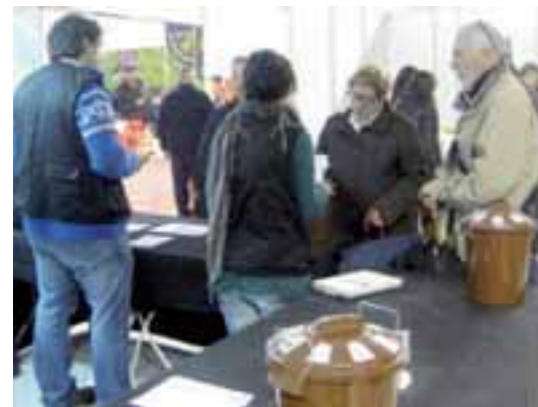
Stand informativo sobre el 5º contenedor.

LA MANCOMUNIDAD DE LA COMARCA DE PAMPLONA también estuvo presente en la feria con un stand informativo sobre el quinto contenedor, cuyo proyecto piloto implantó en Barañáin el pasado mes de noviembre. En la actualidad, se han sumado a la recogida selectiva de materia orgánica un total de 3.218 familias del municipio. En el transcurso de la feria, se contabilizaron 53 nuevas inscripciones. A quienes así lo hicieron, se les entregó un kit compuesto por una llave para abrir el contenedor, un cubo de recogida, un folleto informativo y un adhesivo. El pasado 11 de febrero se cumplieron tres meses desde la puesta en marcha de la iniciativa en Barañáin. En este tiempo, la MCP ha recogido 154.720 kilos, lo que supone la recuperación de un 32% de la materia orgánica generada en la localidad. En la presentación del proyecto, la entidad mancomunada señaló que el objetivo era conseguir que, al menos el 50% de las familias del municipio, se comprometiera con este cambio de hábito a la hora de reciclar. La Mancomunidad también instaló en la feria unos hinchables para los niños.