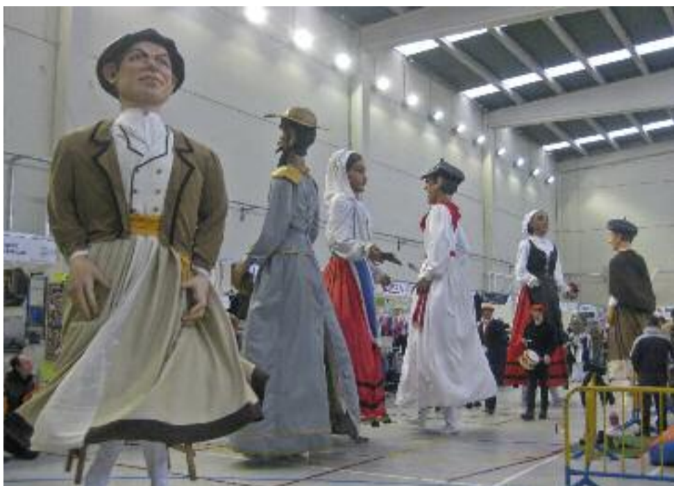
■ Los gigantes no dudaron en darse una vuelta por el “recinto ferial”.