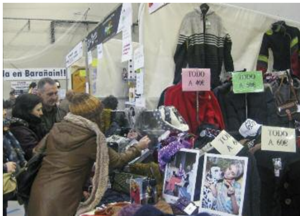
■ La oportunidad de comprar productos de calidad a buen precio conquistó a muchos.