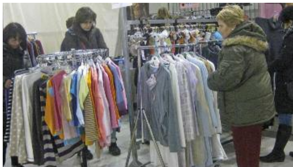
■ La Feria abrió sus puertas los tres días desde las 10:30 h. a las 20:30 h.