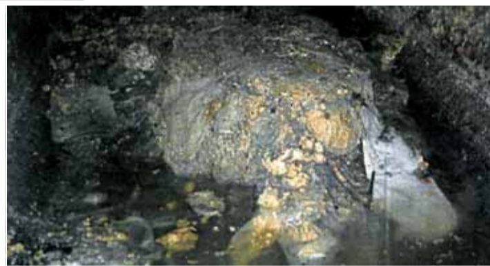
■ Aspecto de la avenida Central, ya sin los chopos, e imágenes de las afecciones que habían provocado las raíces en los colectores de saneamiento.