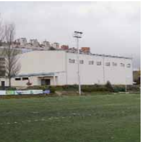
El nuevo polideportivo.

TRAS LA INAUGURACIÓN de la biblioteca el 15 de marzo, la localidad estrenará también otra nueva dotación el viernes 18. En este caso, será el polideportivo que se ha construido en terrenos del Servicio Municipal Lagunak. El nuevo polideportivo responde a una vieja demanda vecinal y fue uno de los proyectos elegidos con cargo al Fondo Estatal para el Empleo y Sostenibilidad de 2010. Su coste ha ascendido a 709.513 euros. Tras ultimar los detalles que restaban y contar con las certificaciones oportunas, el Ayuntamiento pone en marcha esta nueva dotación, que cuenta con una pista con las dimensiones reglamentarias para la competición, con unas gradas portátiles, vestuarios, baños y un pequeño almacén, y que contribuirá a descongestionar la saturación que se vivía en el polideportivo de la avenida Plaza Norte. Miembros de la Junta de Lagunak e