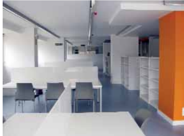
Imagen de una de las salas de lectura de la primera planta y el salón multiusos.