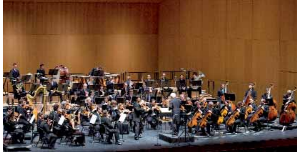
■ La Orquesta Sinfónica se subirá al escenario del Auditorio el 27 de mayo.

Según el convenio pactado entre las dos Fundaciones, el Auditorio tiene garantizados un mínimo de 64 días en fines de semana para la programación de su actividad cultural. Además, podrá disponer de 16 más, también en fin de semana, aunque la orquesta