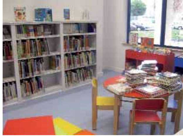
Un pequeño rincón de la sala infantil; vista de la zona de lectura; e imagen del mostrador de información y préstamo, con la zona de lectura al fondo y la escalera de acceso a la planta superior.