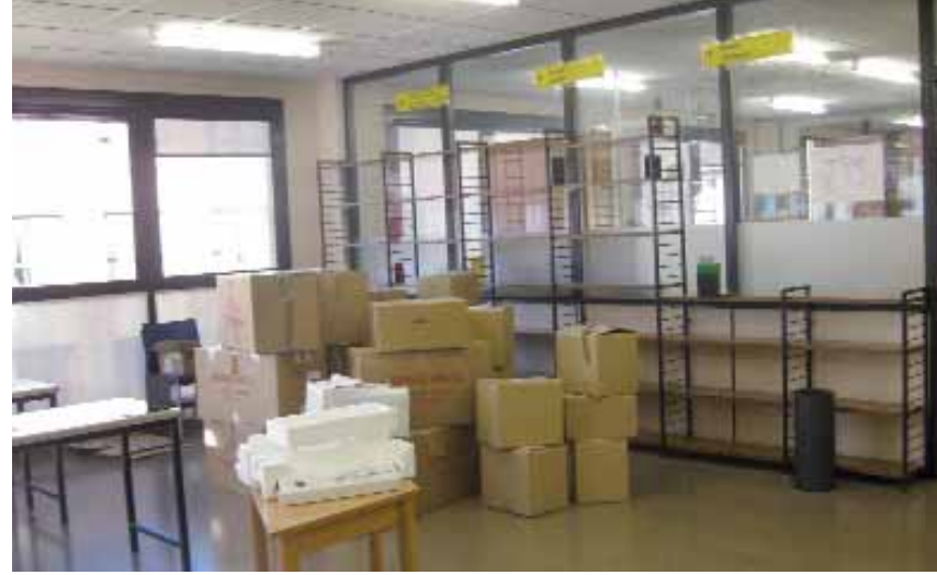
Las dependencias de la Biblioteca en la Casa de Cultura se van vaciando poco a poco.

■ EL TELECENTRO Municipal, ubicado hasta ahora en la avenida Comercial 4, se traslada a la primera planta de la nueva Biblioteca. El Telecentro abrió sus puertas en septiembre de 2006. Con la puesta en marcha y mantenimiento de este servicio, el Ayuntamiento pretende acercar a la ciudadanía la Sociedad de la Información y la Comunicación y servir como herramienta a profesionales, estudiantes, asociaciones, empresas y público en general que requieran un espacio físico y virtual estable donde trabajar en el ámbito de las nuevas tecnologías de la información y la comunicación. Ofrece acceso gratuito a Internet en condiciones de calidad y programa talleres formativos básicos de alfabetización digital. Por otro lado, desde septiembre de 2009, el Telecentro acoge el Aula Mentor, un sistema de formación no reglada, abierta, libre y a través de Internet promovida por el Departamento de Educación del Gobierno de Navarra y dirigida a personas mayores de 18 años.