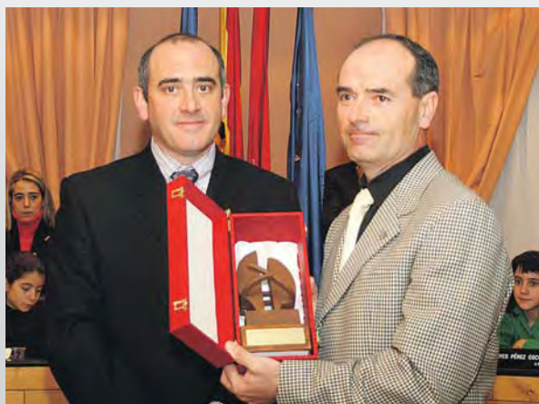
▲ El presidente de Nakupenda África recogió en diciembre el Premio Solidaridad que el Ayuntamiento de Barañain le concedió a la ONG.

L A ASOCIACIÓN de Nakupenda África es una organización formada por voluntarias y voluntarios amigos de África que tiene dos claros objetivos. Por un lado, dar a conocer de la forma más objetiva posible la situación que vive el continente africano y sensibilizar a la sociedad sobre el origen de esas realidades y las posibles medidas de solución. Por otro lado, contribuir en lo posible, con los medios y capacidades que pueda tener y conseguir, a mejorar situaciones concretas de colectivos y acompañar a las contrapartes locales en el Sur, en África.