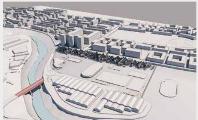
Landabenekin (gorriz) egin litekeen konexioa, Argaren gaineko pasabidetik. Posible conexión con Landaben (en rojo) mediante pasarela sobre el Arga.