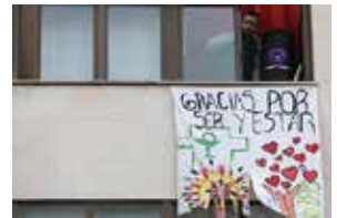
Hainbat momentu Barañaingo kaleetan 2020ko martxotik ekaina bitarte. Varios momentos en las calles de Barañáin entre los meses de marzo y junio de 2020.

Barañaingo alkateak gutun hau bidaltzen die herrian bizi diren guztiei jende guztiarentzat hain zailak izan diren azken hilabete hauetako balantzea egiteko, herritarren konpromisoa eskertzeko eta etorkizunari begira itxaropen eta baikortasuneko mezu bat helarazteko.