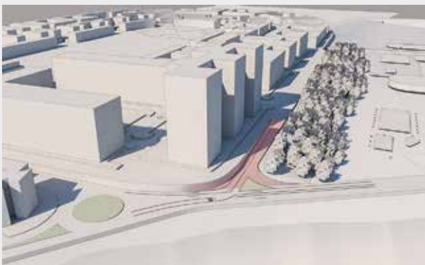
Estadioko Pasealekuarekin (gorriz) egin litekeen konexioa. Posible conexión (en rojo) con el Paseo del Estadio.