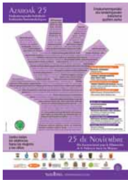
■ Imágenes correspondientes a la campaña contra la violencia machista.

BARAÑAIN HA GRABADO EL DOCUMENTAL 'ISONOMÍA' PARA SENSIBILIZAR SOBRE LA IGUALDAD ENTRE HOMBRES Y MUJERES; SE PROYECTARÁ EL DÍA 25 EN EL AUDITORIO