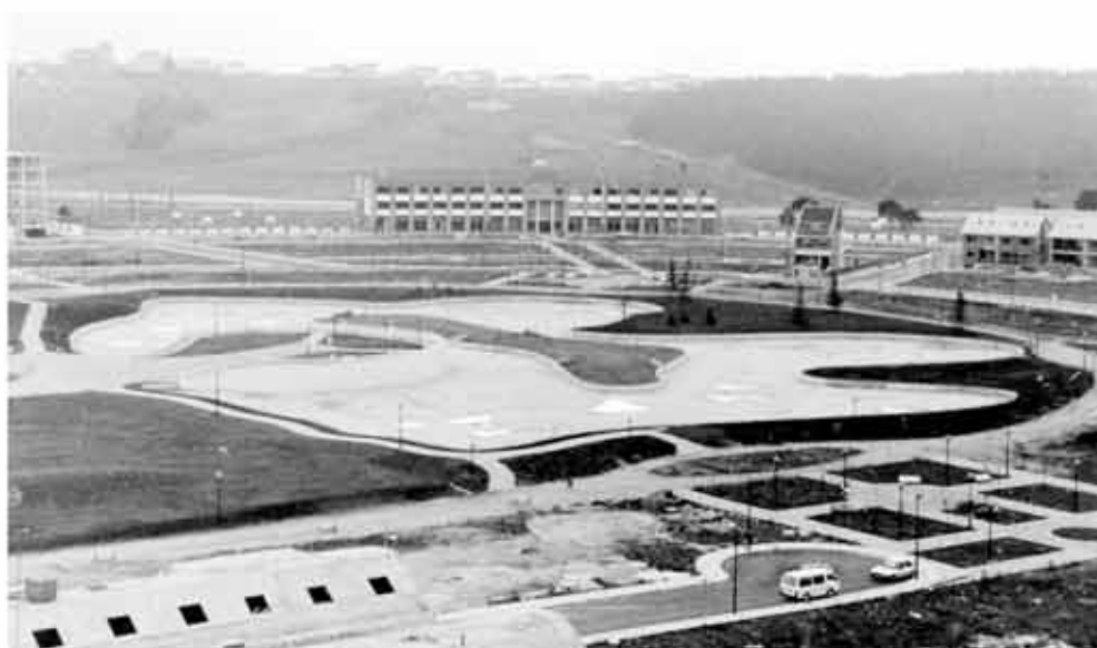
■ Urbanización del denominado Plan Parcial, con el Lago como elemento central. En esta imagen de 1992 pueden verse las primeras edificaciones, incluido el C.P. Eulza, que durante un tiempo fue el único edificio construido en toda la zona.

En esos momentos, y a pesar de contar con una población cercana ya a los 15.000 habitantes, el funcionamiento administrativo de Barañain se desarrollaba en los antiguos