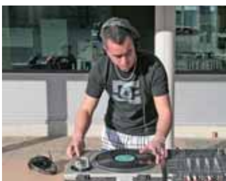
■ Sesión de DJ en la calle.

Cesiones de salas: tienes la posibilidad de solicitar la sala de baile, el taller o el espacio de usos múltiples para ensayar con tu grupo, bailar, estudiar, jugar... bien un día puntual o de forma trimestral.