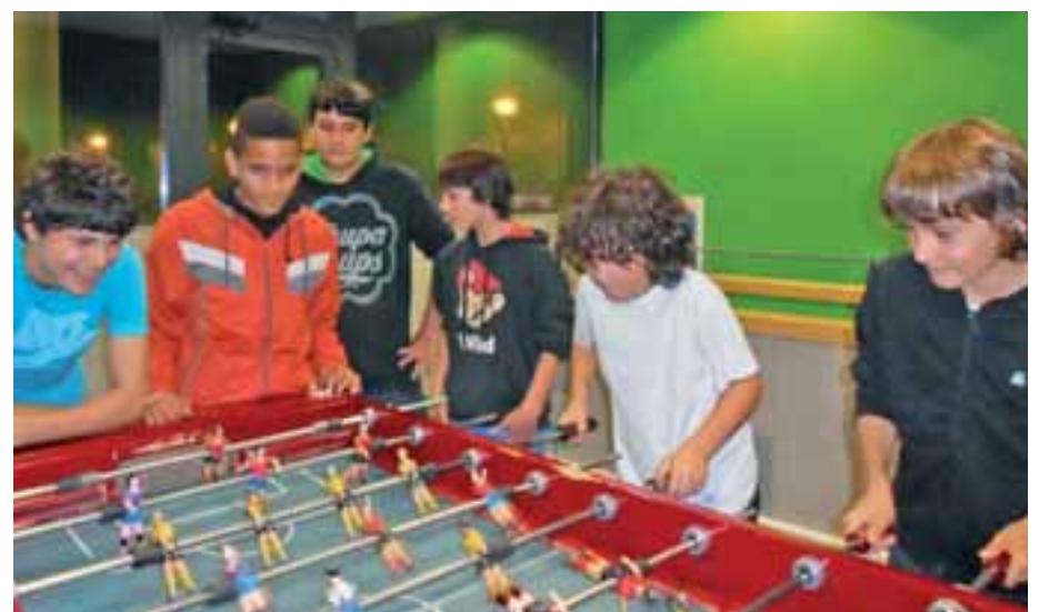
■ En el Área de encuentro se ofrecen diferentes posibilidades de ocio.