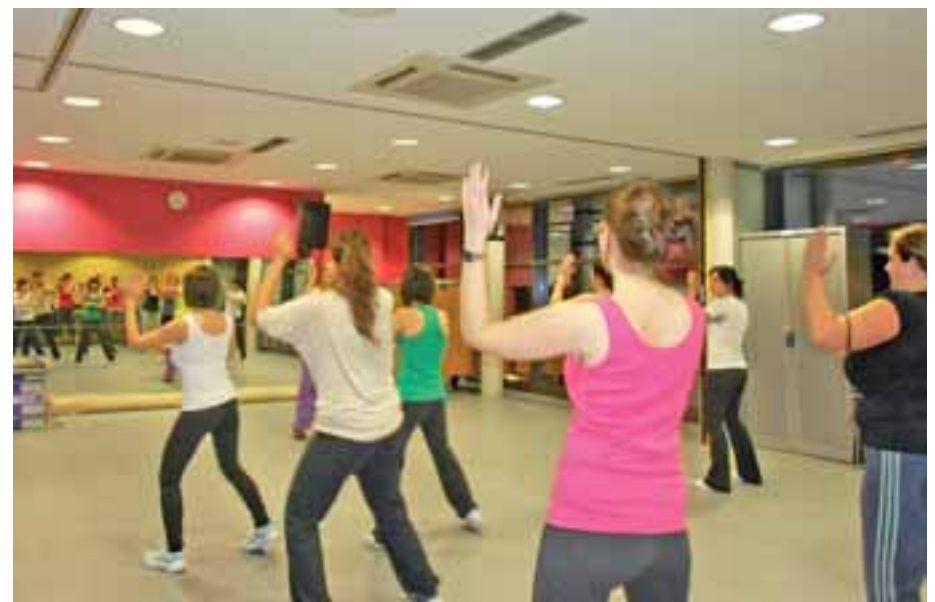
■ Baragazte ofrece también un programa de cursos a lo largo de todo el año.