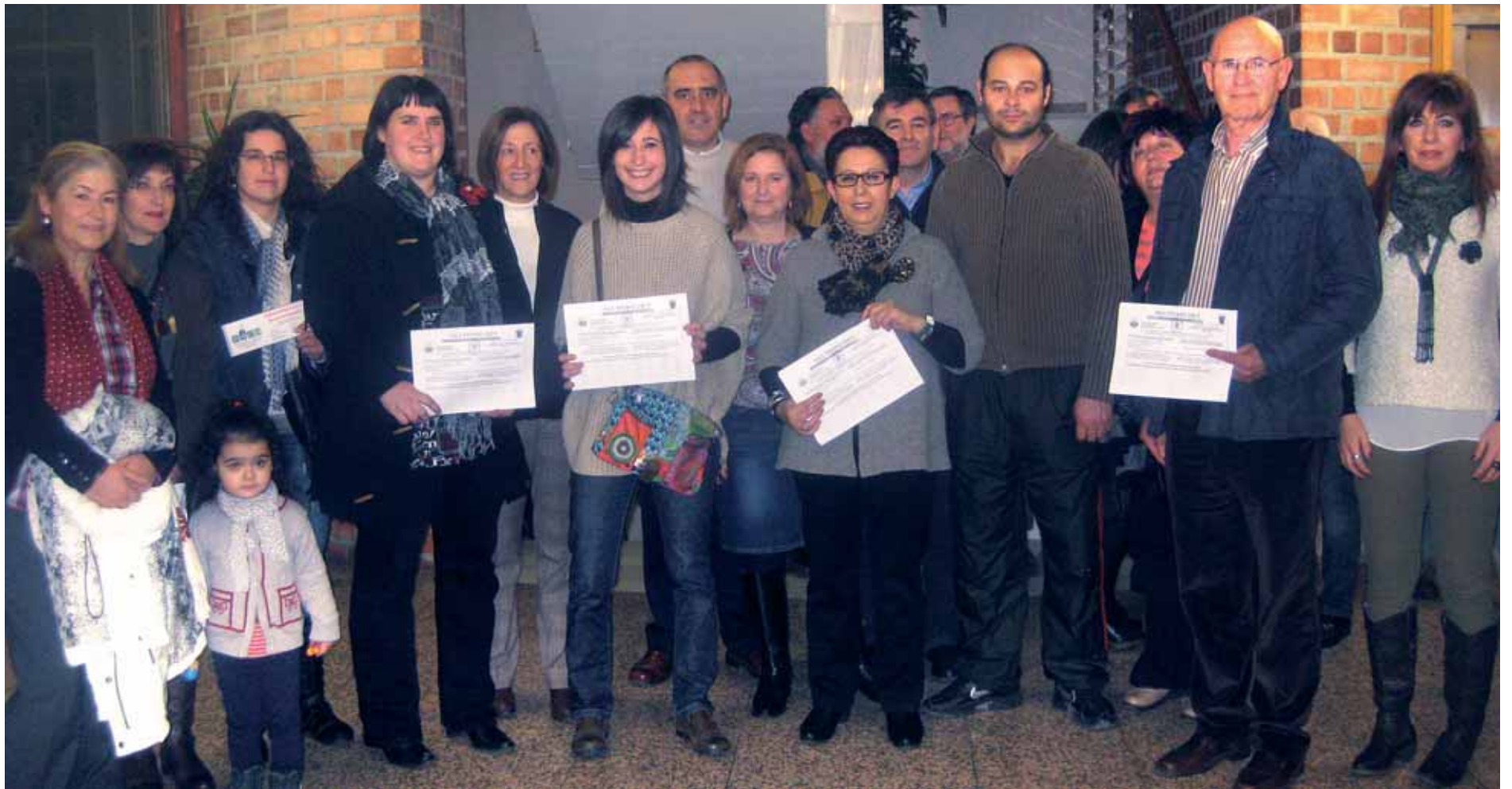
Las personas premiadas posaron juntas tras recibir los vales que les acreditaban como ganadoras.