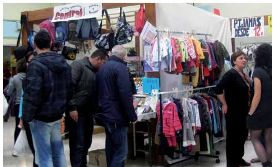
La primera Feria de Oportunidades de Barañáin tuvo lugar el año pasado.

Gecona Calzados, Sache, La Guinda, Librería Ada, Masmarco, Mercería Araceli, Mercería Dabea, Raw Shop, Calzados&Sais, Mercería María, Tea Moda Infantil, Deportes Alai Sport, Costuras Nunchi, Mercería Ailea, Cuadros Larráyoiz, Ferretería José Antonio, Peluquería Nuria's, Peluquería Sonia Barcina y Asociación de Comerciantes San Esteban. Además, colaborarán en la Feria Proyecto Odipus (bodegas), Panadería Pastelería Zabaleta y Carnicería Irigoyen.