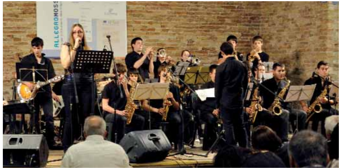
Un momento del concierto ofrecido en la ciudad italiana de Bolonia el pasado mes de mayo.

rondo complete el mapa de las provincias españolas. No resulta sencillo organizar estos viajes, que requieren de una importante logística, aunque la experiencia es un grado. "Movemos a muchos alumnos y eso implica una buena organización. Nos han sucedido varias anécdotas como estar a punto de perder un avión, que algún alumno