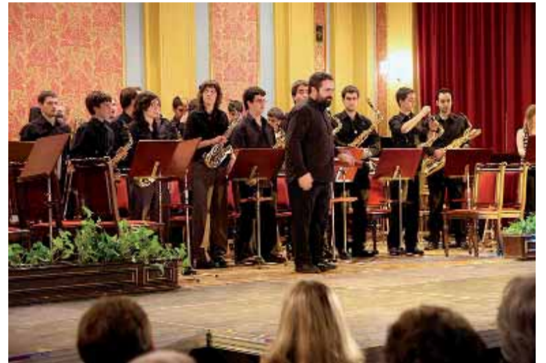
Actuación en la gira por Polonia en abril de 2007.

pendia", afirma el director. Una de las salidas más significativas del último curso tuvo como destino la ciudad italiana de Bolonia, que acogió en el mes de mayo un encuentro de escuelas de música europeas.