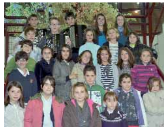
Alumnos de acordeón que participaron en el último certamen de Arrasate-Mondragón.