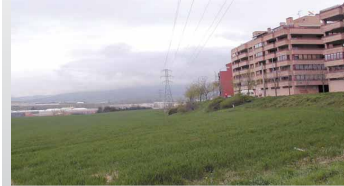
Terrenos en los que se construirán las viviendas.

Guztira 920 etxebizitza dira egitekoak, horietatik aurreikusi dituzte eta horietatik erdiak babestutakoak izanen dira. Gainera, babestuak izanen diren 150 Barañaingo udalak herritarren artean banatuko ditu. 2006. urtean aurkeztu zuten plan horixe, etxebizitzak eraikitzeara alegia eta urtebeteren ostean hasi zituzten mugimenduak planak argia ikusi zezan.