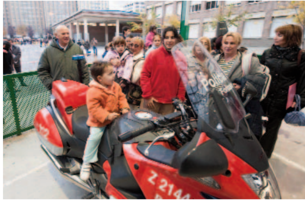
Jornada de educación vial llevada a cabo el año pasado en el colegio Los Sauces por la Policía Foral

SON MUCHAS las campañas que, a lo largo de los últimos años, ha llevado a cabo tanto la Dirección General de Tráfico como diversas entidades con el propósito de reducir la siniestralidad en las carreteras. Precisamente, en el marco de este objetivo, en 2006 se creó la Carta Europea de la Seguridad Vial, que abarca a todos los Estados miembros de la Unión Europea.