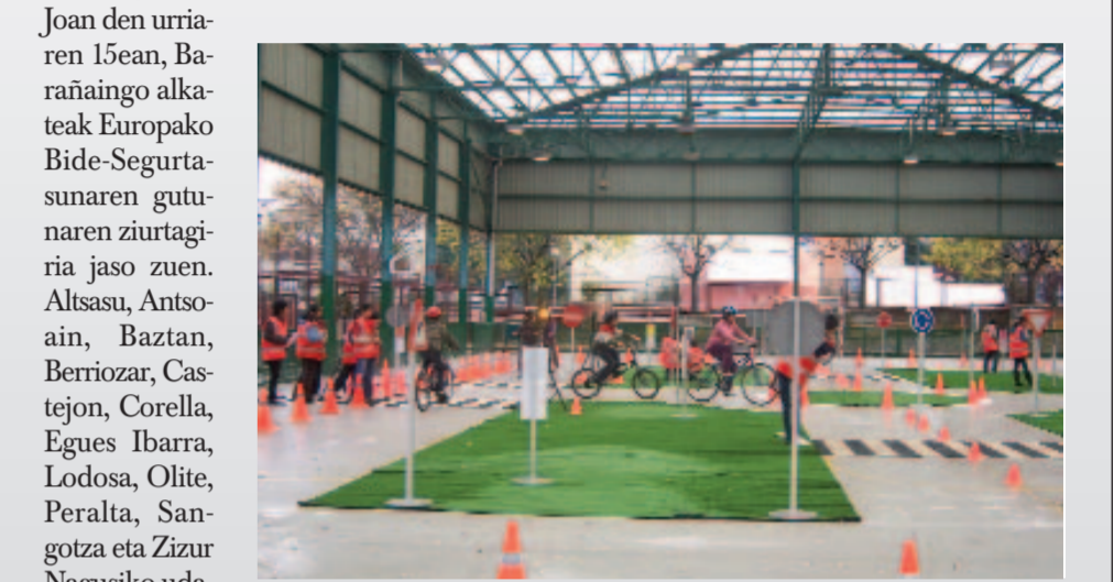
Sahats ikastetxean, informazio-kanpaina batean.

TRAFIKO ISTRIPUAK gutxiti nahi ditu Barañaingo Udalak, horretarako, joan den hilabetean Bide-Seguritasunaren Europako Gutunarekin bat egin zuen. Ildo honetan, gutunarekin bat egiten duten elkarteek, enpresek eta entitateek ekintza zehatzak burutzeko eta praktika onak konpartitzeko eta trukatzeko konpromisoak hartzen dituzte.