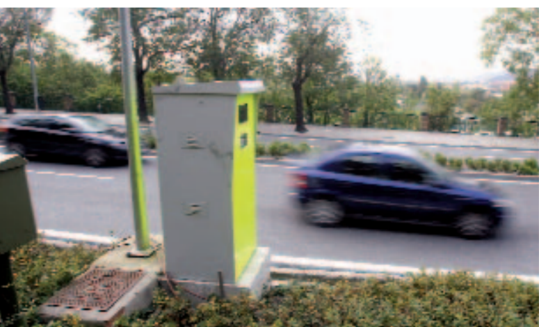
Una de las acciones que llevará a cabo Barañáin será la instalación de un radar fijo y la adquisición de radares móviles.

Entre el 18 y el 22 de octubre, la Policía Municipal de Barañáin llevó a cabo una campaña de seguridad vial en colaboración con la Policía Foral. Se efectuaron 11 controles en los que se comprobó la documentación y las condiciones técnicas de 1.494 vehículos. Como consecuencia de estas revisiones, se denunció a 22 conductores, lo que supone el 1,47% del total de inspeccionados. Seis de las denuncias se debieron a irregularidades con la ITV, 3 por cuestiones relacionadas con el permiso de conducir, 3 por usar de forma incorrecta el cinturón de seguridad, otras 3 por temas vinculados al seguro obligatorio y por el uso del teléfono durante la conducción y el resto, 6 denuncias más, por otras causas. Por otro lado, según se recoge en el informe de Policía Municipal de 2009, el año pasado se produjeron en Barañáin un total de 161 accidentes de tráfico. El mes con mayor número de siniestros fue febrero, con un total de 23, seguido de junio, con 20. El mes en el que se registró un menor número de accidentes fue agosto, con 6. Fruto de estos siniestros, 28 personas resultaron heridas de diferente consideración. El único mes en el que no se registraron heridos, a pesar de los 17 accidentes contabilizados, fue mayo. Asimismo, en el informe elaborado por Policía Municipal se recogen 1.107 denuncias de tráfico y 10 detenciones por alcoholemia. Precisamente, la realización de controles de alcoholemia es una de las intervenciones especiales efectuadas por los agentes.