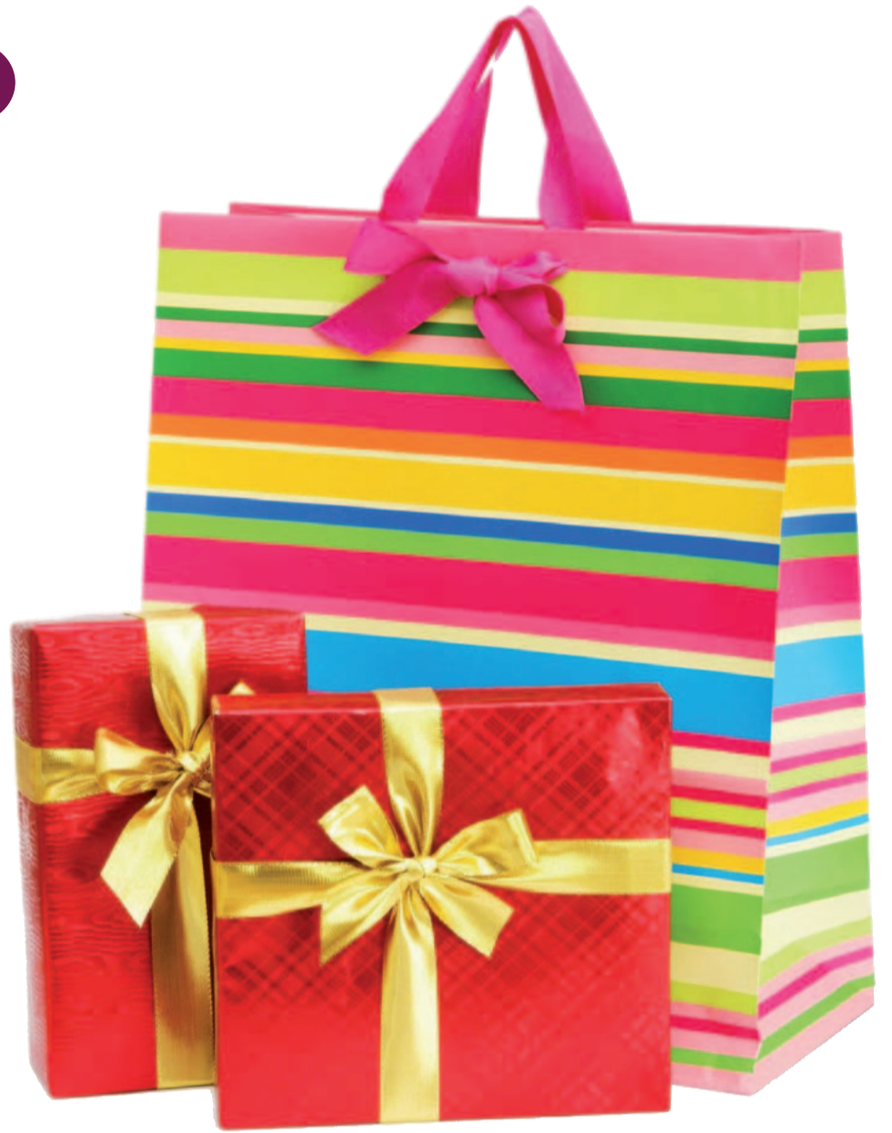
■ Comprar en Barañáin puede depararte una agradable sorpresa.

de casa tiene su recompensa. Estas navidades, además de adquirir los productos deseados sin salir de Barañáin (textil, calzado, alimenta-