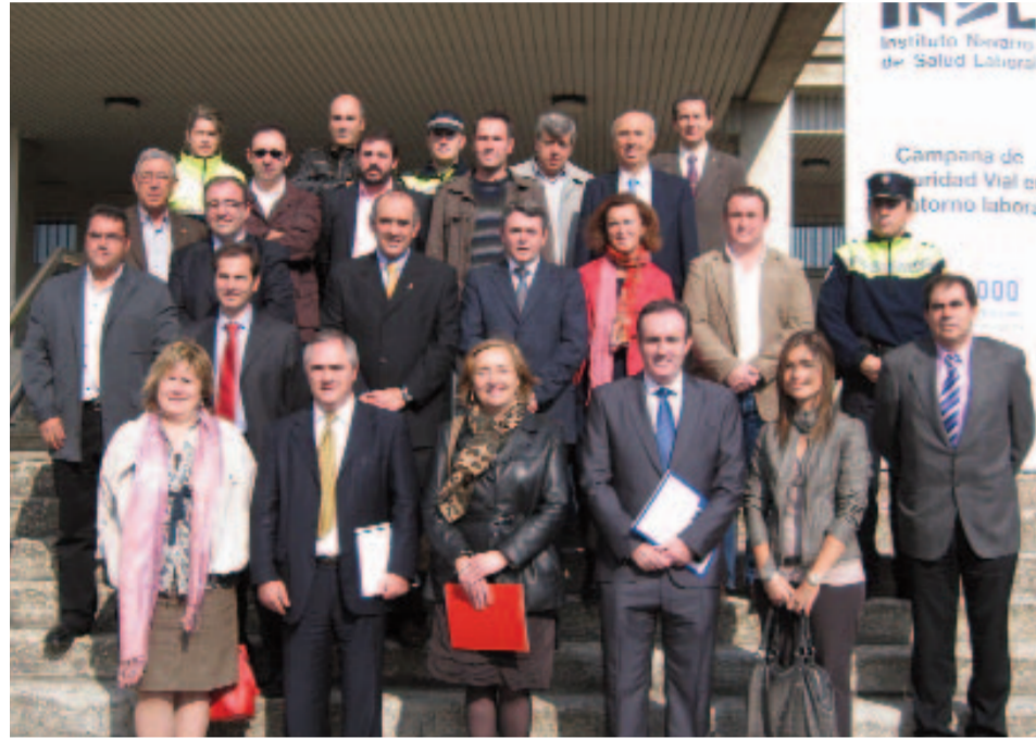
Entrega de certificados a los consistorios que se han adherido recientemente a la Carta Europea de Seguridad Vial

LA UNIÓN EUROPEA SE PROPUSO LA META DE QUE EL NÚMERO DE FALLECIDOS POR ACCIDENTES DE TRÁFICO EN 2010 NO SOBREPASARA LOS 25.000; EN EL CAMINO PARA ALCANZAR ESTE PROPÓSITO, CREÓ LA CARTA EUROPEA DE LA SEGURIDAD VIAL, A LA QUE ESTE AÑO SE HA ADHERIDO BARAÑÁIN